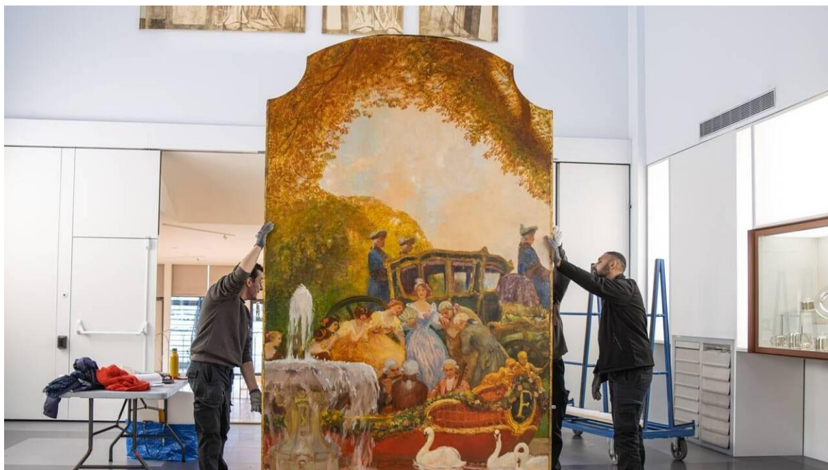
« L'arrivée de la princesse » aux dimensions généreuses (3,11 m x 1,92 m) est arrivée ce mercredi matin à Escal'Atlantic.

C'est une œuvre monumentale qui a été acquise en février 2024 à Londres. Peinte en 1911 par Gaston La Touche, « L'arrivée de la princesse » ornait le grand escalier de la salle à manger de 1 re classe du paquebot France, lancé à Saint-Nazaire en 1912.