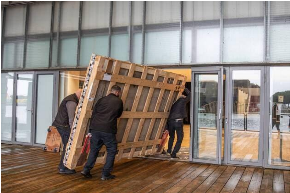
L'arrivée du tableau à Escal'Atlantic.