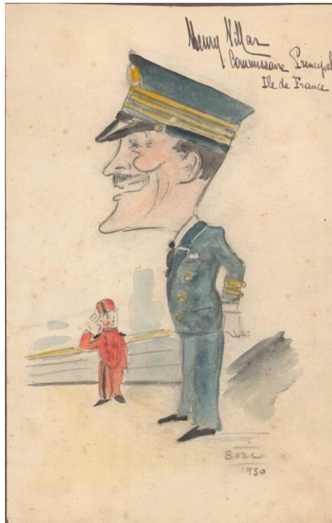
Le groom en uniforme rouge du dessinateur Robert Velter qui allait devenir le fameux Spirou.

Autre achat intéressant : les 37 dessins et caricatures de célébrités de l'époque (Mistinguett, Joséphine Baker, Maurice Chevalier, etc.) de Robert Velter, alias Rob-Vel dit aussi Bozz. C'est lui le vrai père du célèbre groom (appelé mousse de sonnerie à bord des paquebots) en uniforme rouge qui allait devenir le fameux Spirou aux Éditions Dupuis.