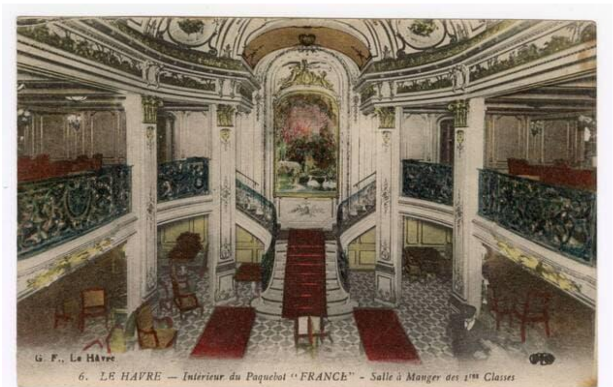
« L'arrivée de la princesse » ornait le grand escalier de la salle à manger de 1re classe du paquebot France lancé à Saint-Nazaire en 1912.